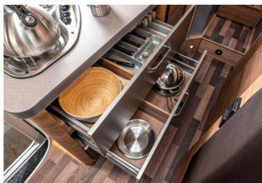
Hochwertiger kugelgeführter Auszug mit Soft-Close, mit Besteckeinsatz.