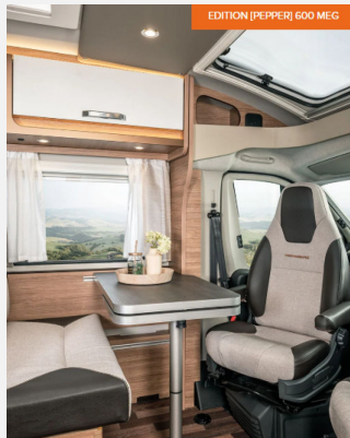
EDITION [PEPPER] 600 MEG