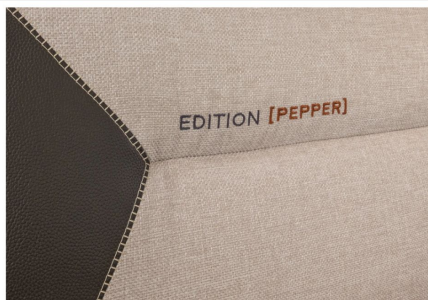
Strapazierfähig: Der exklusive Active-Line Polsterstoff MALABAR in Kunstleder-Stoffkombination und besonderer Ziernaht.