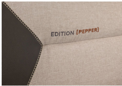
Strapazierfähig: Der exklusive Active-Line Polsterstoff MALABAR in Kunstleder-Stoffkombination und besonderer Ziernaht.