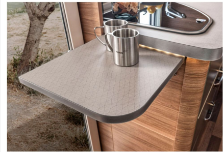
Klappbare Arbeitsplattenverlängerung. Die praktische Verlängerung mit Einhandbedienung schafft zusätzliche Arbeitsfläche.