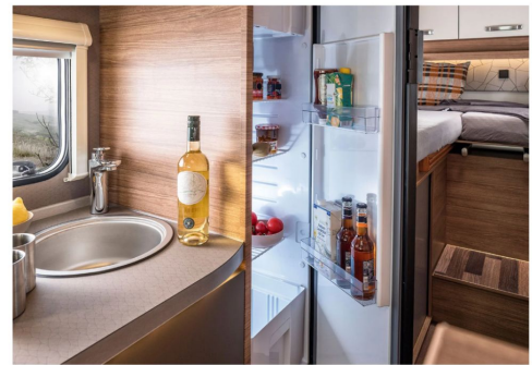
Da geht ordentlich was rein. SlimTower Kühlschrank mit 142 Liter.