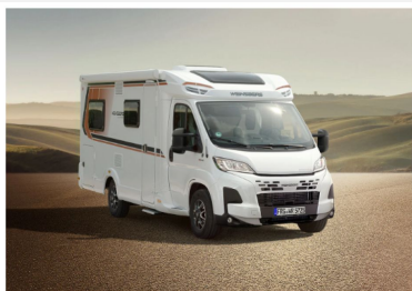
Echter Hingucker: Die Exterieur-Beklebung in Kupfer-Anthrazit.