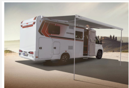
Immer gut geschützt: Die serienmäßige Markise macht Deinen Urlaub noch angenehmer.