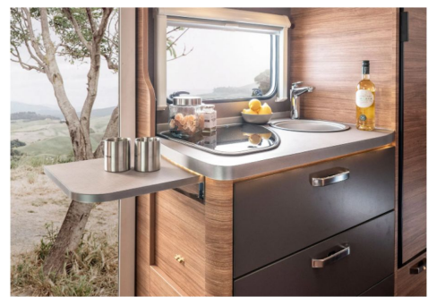
Küche mit klappbarer Arbeitsplattenverlängerung.