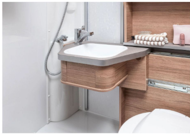
Das platzsparende Waschbecken kann je nach Bedarf hin- und hergeschoben werden.