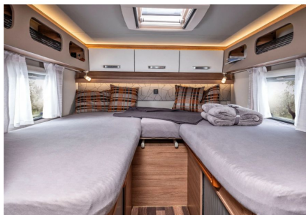
Durchdacht: Ablagefächer und die Deckenschränke mit den exklusiven WEINSBERG Griffen sorgen für viel Stauraum.