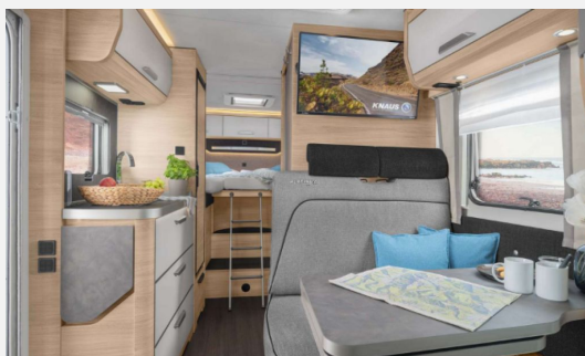
Modernes Design & top Ausstattung