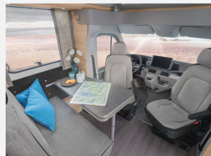
Monositzgruppe mit Einhängetisch, inkl. ausdrehbarer Tischverlängerung