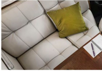
PRESTIGE Kunstleder Serienausstattung