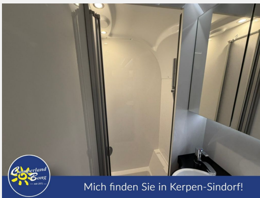
Mich finden Sie in Kerpen-Sindorf!