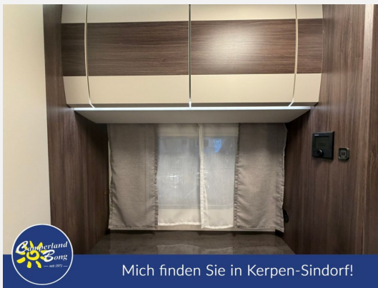
Mich finden Sie in Kerpen-Sindorf!