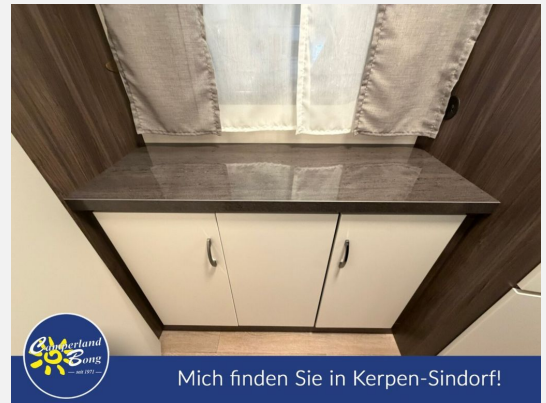
Mich finden Sie in Kerpen-Sindorf!