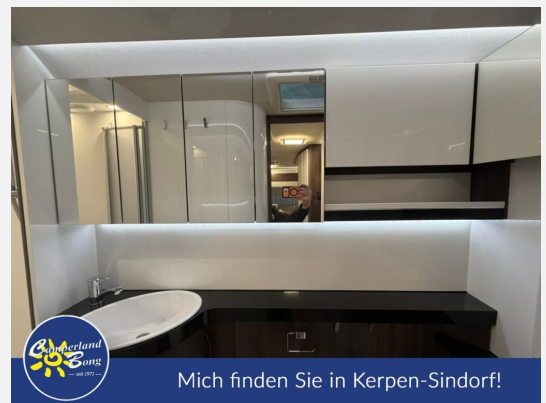
Mich finden Sie in Kerpen-Sindorf!