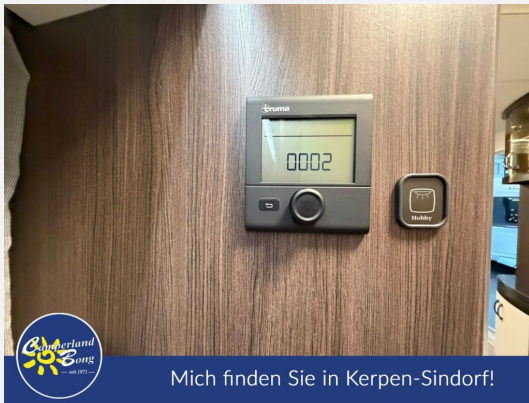
Mich finden Sie in Kerpen-Sindorf!