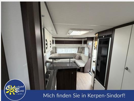
Mich finden Sie in Kerpen-Sindorf!