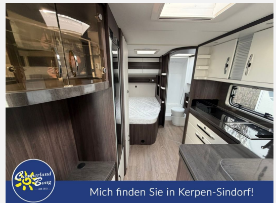
Mich finden Sie in Kerpen-Sindorf!