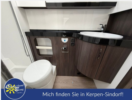
Mich finden Sie in Kerpen-Sindorf!