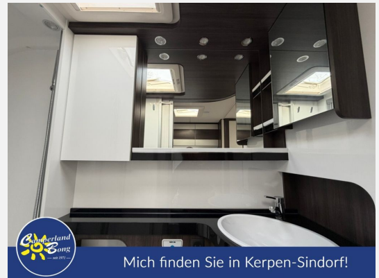
Mich finden Sie in Kerpen-Sindorf!