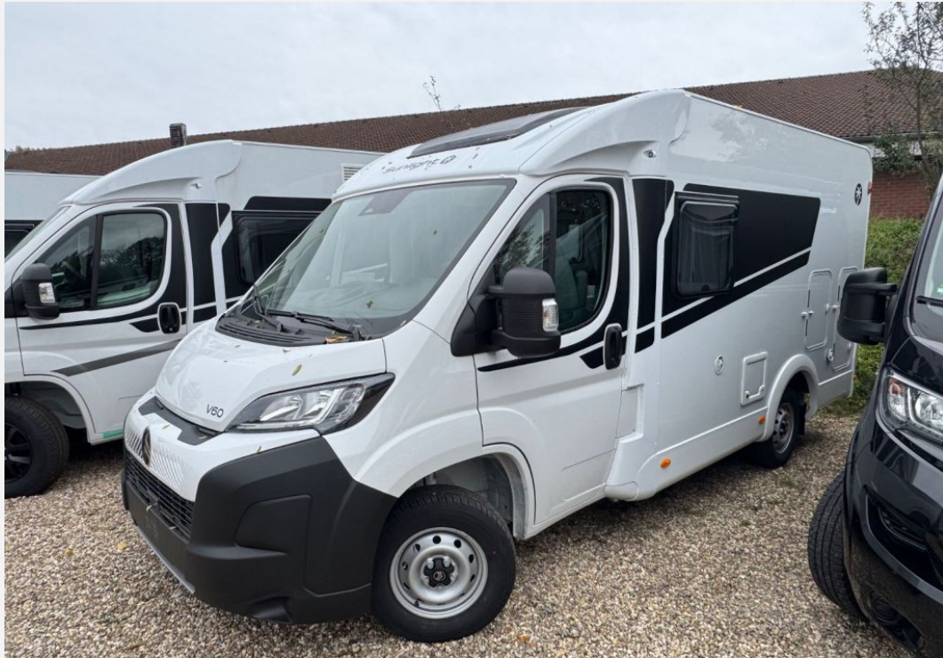
Originalfotos vom angebotenen Fahrzeug