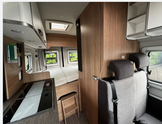
Umbau Sitzgruppe zu Notbett