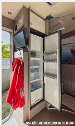
175 L KÜHL-GEFRIERSCHRANK THETFORD