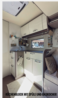
KÜCHENBLOCK MIT SPÜLE UND GASKOCHER