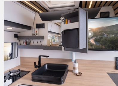
Kosmetikschrank Küche mit innenliegendem Spiegel