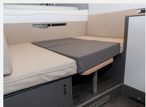
Bequemer Bettumbau der Sitzgruppe