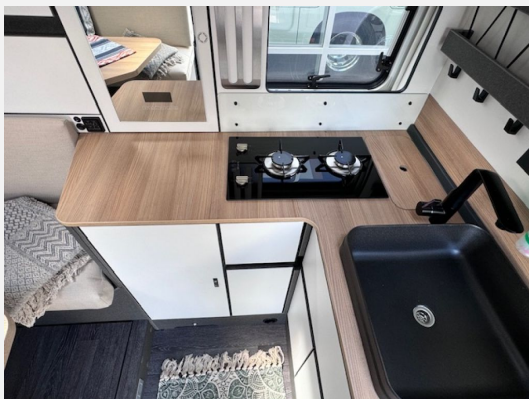
Möbelklappen in Weiß/Absatzdekor Linum Haithabu