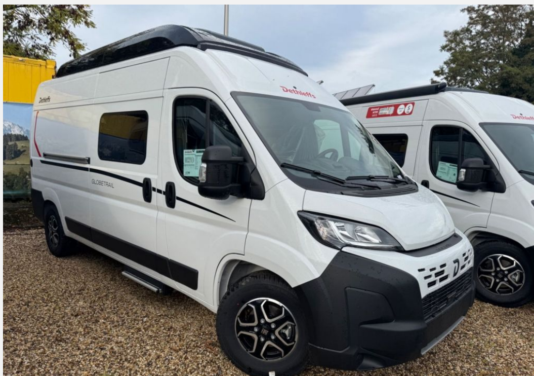
Originalbilder vom angebotenen Fahrzeug