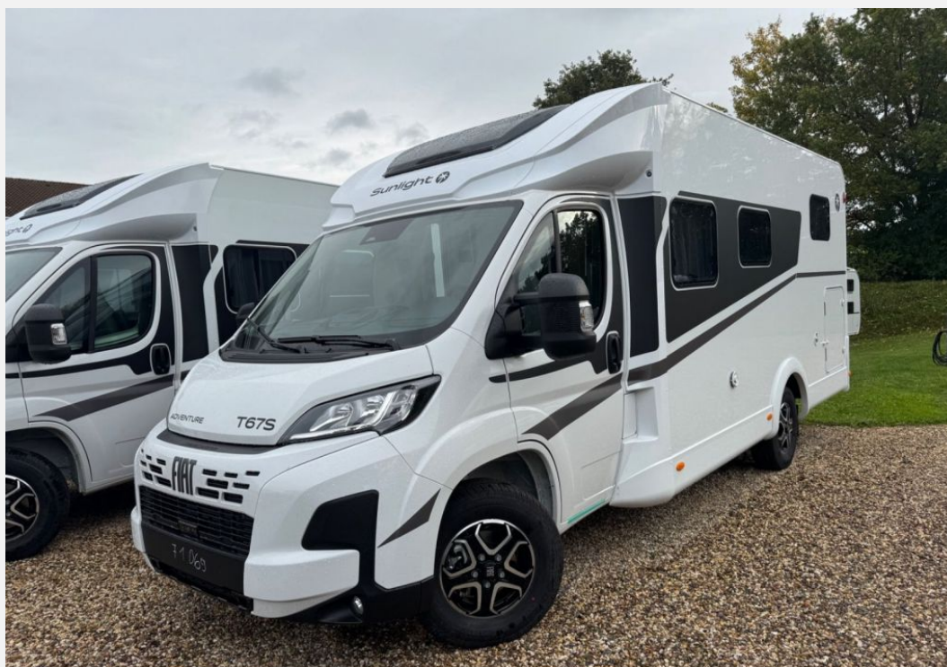
Originalbilder vom Fahrzeug