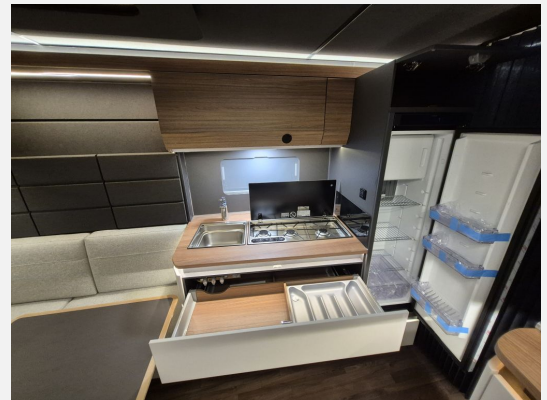
Aufklappbare Arbeitsplattenverlängerung an der Küche in der Smart-Wall