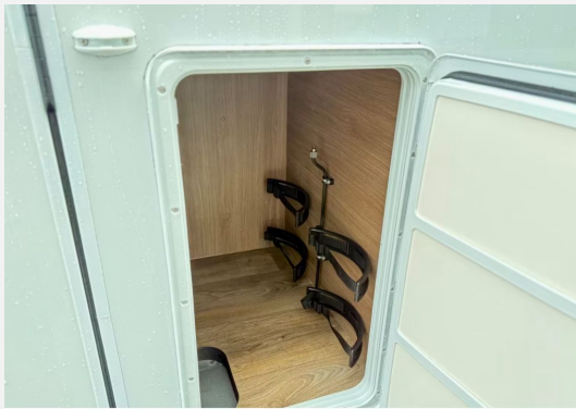
Platz für 2x Gasflaschen