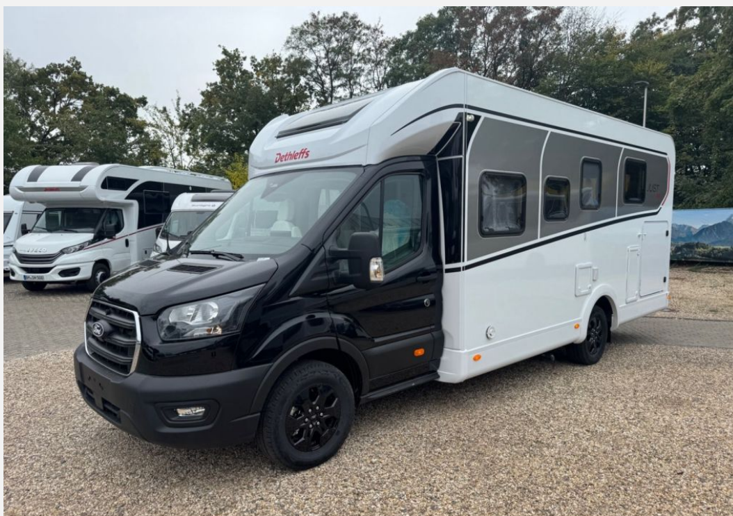
Originalbilder vom angebotenen Fahrzeug