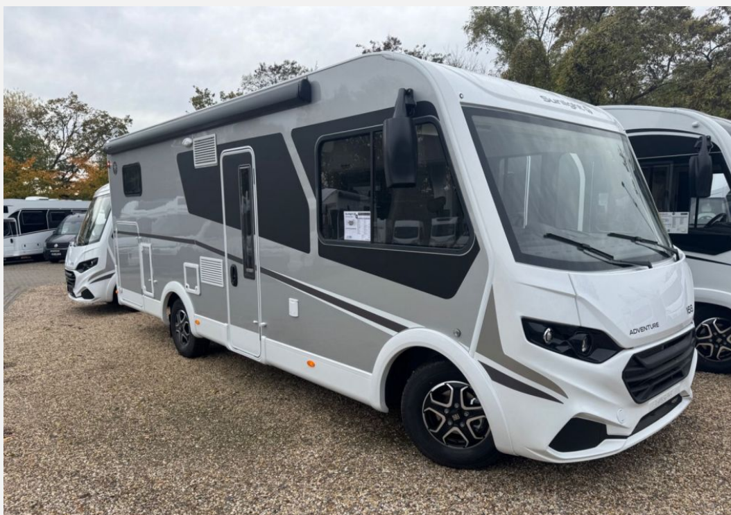
Originalbilder vom Fahrzeug