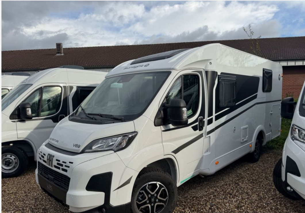
Originalbild vom angebotenen Fahrzeug