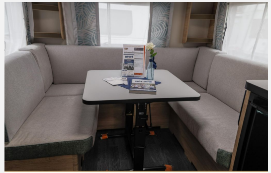
gérard Caravaning 08803 / 63 64-0 info@wohnwagen-gerard.de KNAUS WEINSBERG INTER CARAVANNING RENT OF TRAVEL FENOT CARAVAN