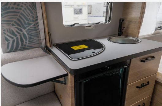
gérard Caravaning 08803 / 63 64-0 info@wohnwagen-gerard.de KNAUS WEINSBERG INTER CARAVANNING RENT OF TRAVEL FENOT CARAVAN