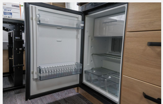
gérard Caravaning 08803 / 63 64-0 info@wohnwagen-gerard.de KNAUS WEINSBERG INTER CARAVANNING RENT OF TRAVEL FENOT CARAVAN