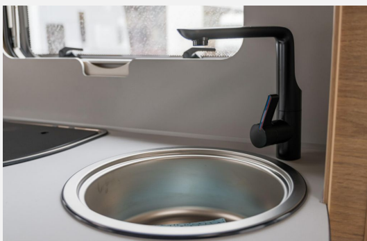
gérard Caravaning 08803 / 63 64-0 info@wohnwagen-gerard.de KNAUS WEINSBERG INTER CARAVANNING RENT OF TRAVEL FENOT CARAVAN