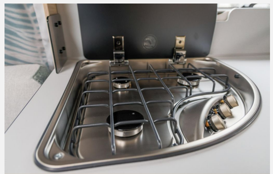
gérard Caravaning 08803 / 63 64-0 info@wohnwagen-gerard.de KNAUS WEINSBERG INTER CARAVANNING RENT OF TRAVEL FENOT CARAVAN