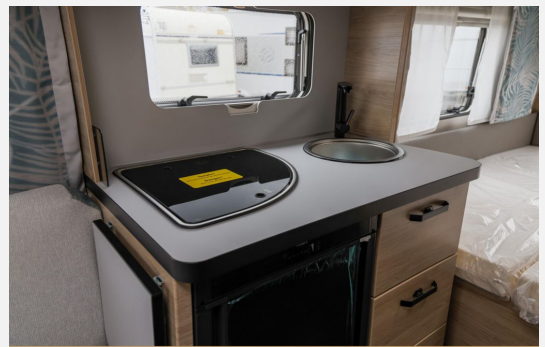
gérard Caravaning 08803 / 63 64-0 info@wohnwagen-gerard.de KNAUS WEINSBERG INTER CARAVANNING RENT OF TRAVEL FENOT CARAVAN