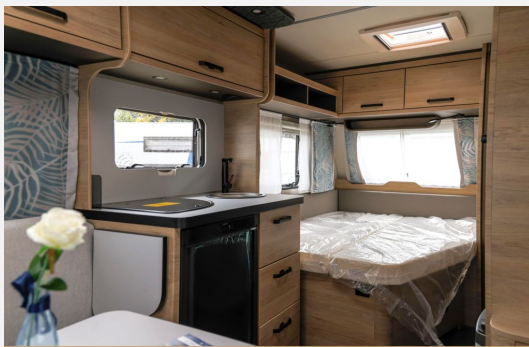
gérard Caravaning 08803 / 63 64-0 info@wohnwagen-gerard.de KNAUS WEINSBERG INTER CARAVANNING RENT OF TRAVEL FENOT CARAVAN