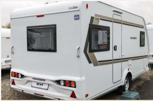
gérard Caravaning 08803 / 63 64-0 info@wohnwagen-gerard.de KNAUS WEINSBERG INTER CARAVANNING RENT OF TRAVEL FENOT CARAVAN