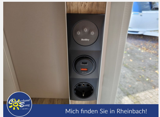
Mich finden Sie in Rheinbach!