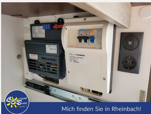
Mich finden Sie in Rheinbach!