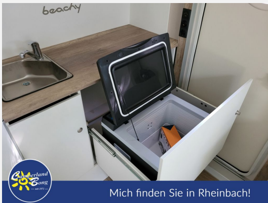
Mich finden Sie in Rheinbach!