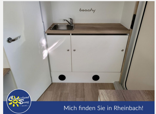
Mich finden Sie in Rheinbach!