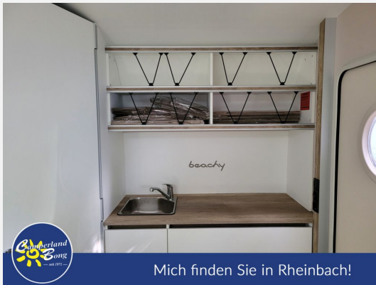
Mich finden Sie in Rheinbach!